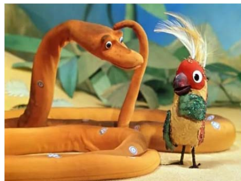
А в попугаях то я значительно

удава - это 4 попугая, значит один попугай – 25 см.